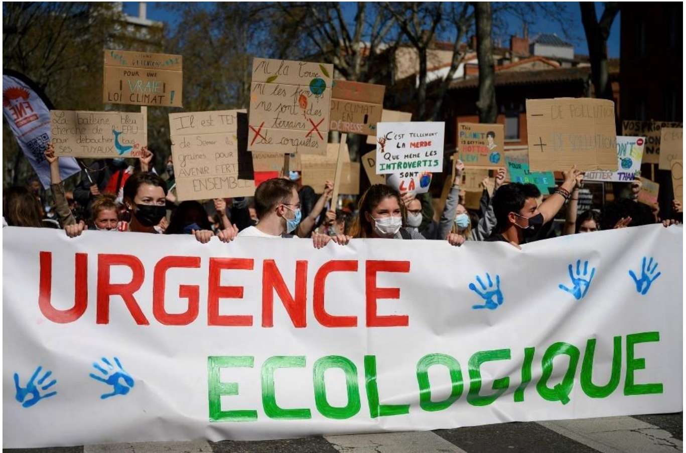
Marche pour le climat – 28 mars 2021 à Toulouse